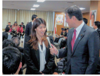
H26.1 ネットメディア局次長としてインタビュー