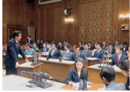
H26.10 予算委員会にて質問