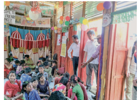
H30.3 バングラデシュ避難民キャンプ視察