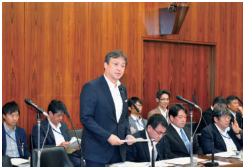
H29.8 外務大臣政務官として外交防衛委員会にて答弁