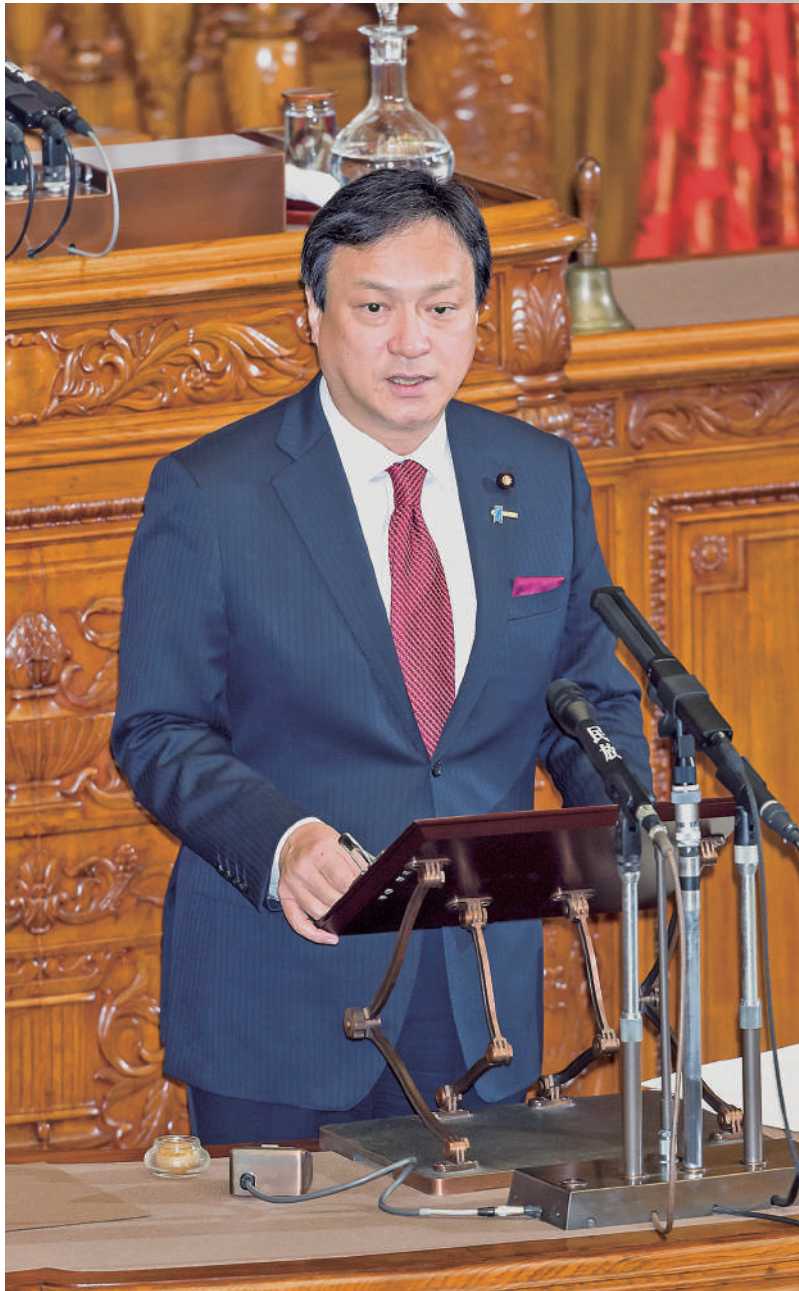
平成30年12月参議院本会議