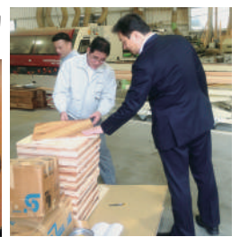
H26.5 県産材工場にて意見交換