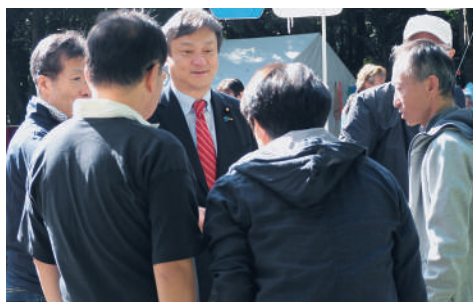
H30.10 歯科医師の方々と意見交換