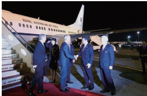
H30.1 タンブル・オーストラリア連邦首相を出迎え