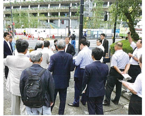
地元関係者と共に新国立競技場を訪問