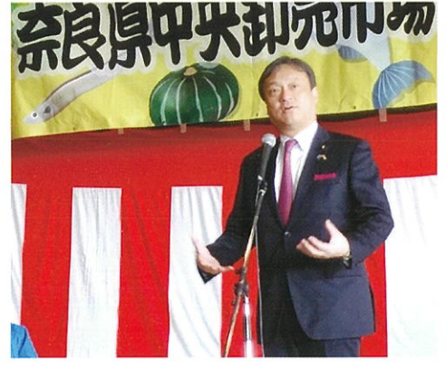
奈良県中央卸売市場にて、冬の市場まつり