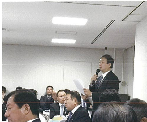
自民党内にて参議院報告と意見交換を行う