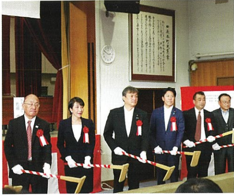
田原本町にて、田原本町雨水貯留施設起工祝賀会