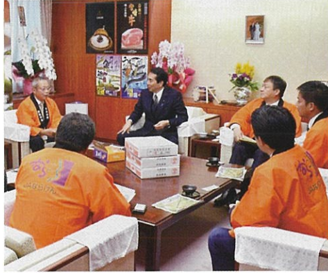
天理市長はじめ関係者と共に「利根早生柿」を江藤拓農林水産大臣へ