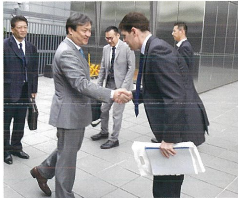
在日オーストラリア大使館を訪問