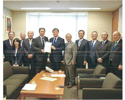
「簡易水道・治水砂防予算に関する要望」をしっかりと受けとめる