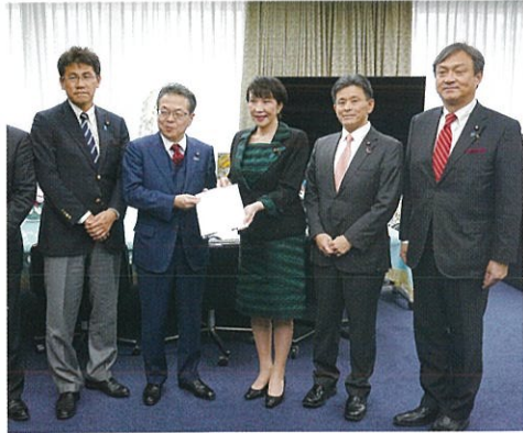
不安に寄り添う政治のあり方勉強会、高市総務大臣に申し入れ