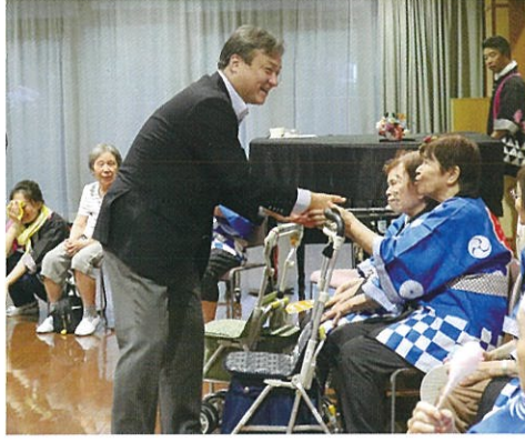
長命荘にて、夏祭り