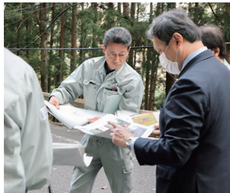
2020年4月国道169号線下北山村上池原地内の崩落現場