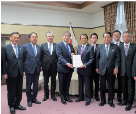
2020年12月麻生財務大臣に「道路整備、治水、砂防予算確保」を要望