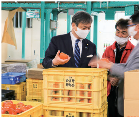
2020年11月五條市西吉野柿選果場