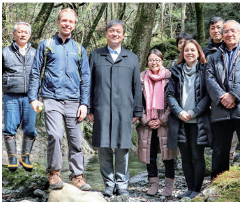
2020年3月川上村森と水の源流の地にて