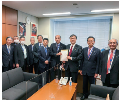
2020年11月議員会館にて地元の皆様と