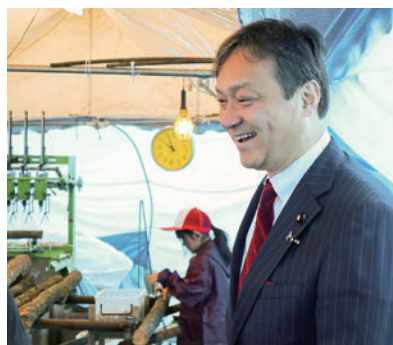
2020年2月吉野町内のしいたけ栽培場

さらに令和2年末には、「感染拡大防止と社会経済活動の両立」を基本戦略に、税制改正大綱を取りまとめ、19兆円超の第3次補正予算案と106兆円超の令和3年度予算案が「15カ月予算」の考え方で編成されました。切れ目のない経済対策を行い、事業と雇用を守り抜き、すべての国民が安心した生活を1日も早く取り戻せるよう通常国会での早期成立に向けて取り組んでまいります。