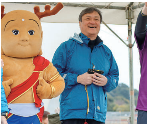
2020年1月平城宮跡リレーマラソン大会