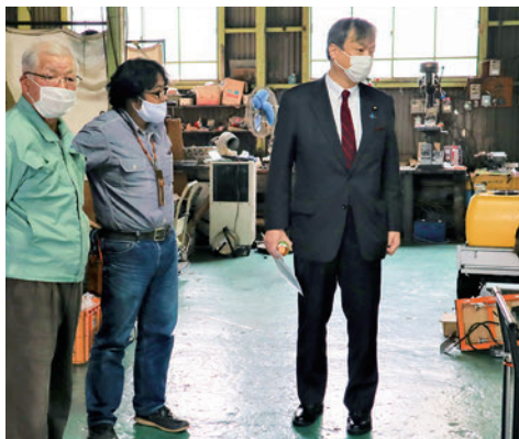
2020年11月大和高田市内の精密機器メーカー