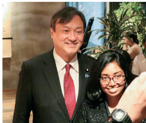
2020年11月駐日外交団が来奈