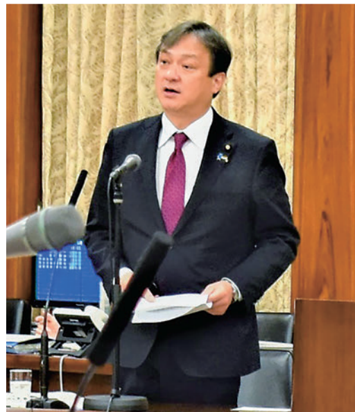
2020年3月参議院総務委員会