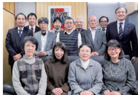
堀井事務所のメンバー全員集合