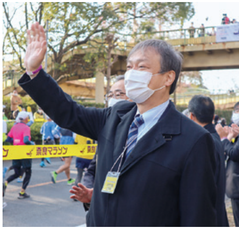
令和3年12月 奈良マラソンオープニング セレモニーにて