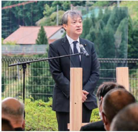
令和3年9月 紀伊半島大水害五條地区慰 霊祭にて