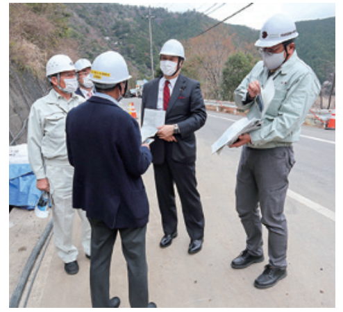
令和3年3月 国道168号線十津川村風屋 地内の崩落個所にて