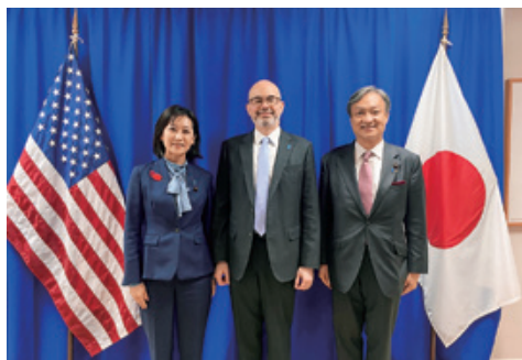
2021年10月米国大使館 レイモンド・グリーン臨時大使を訪問