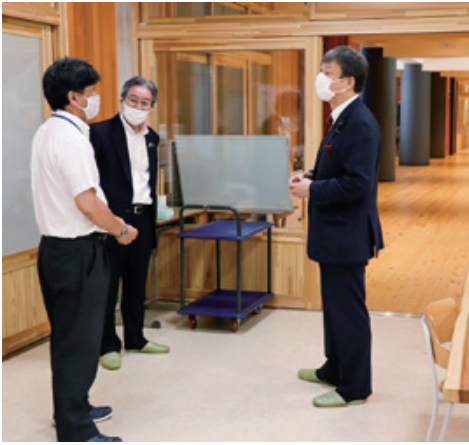
令和3年8月 地元の森林資源をふんだんに 使用した下北山村立下北山中学校を訪問