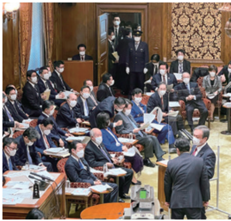
令和3年12月 参議院予算委員会の理事と して