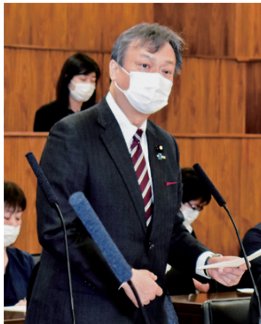
自由民主党副幹事長 参議院議員