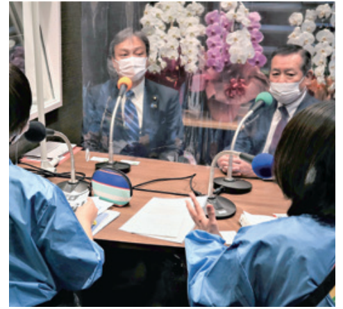
令和3年2月 FMやまとに出演