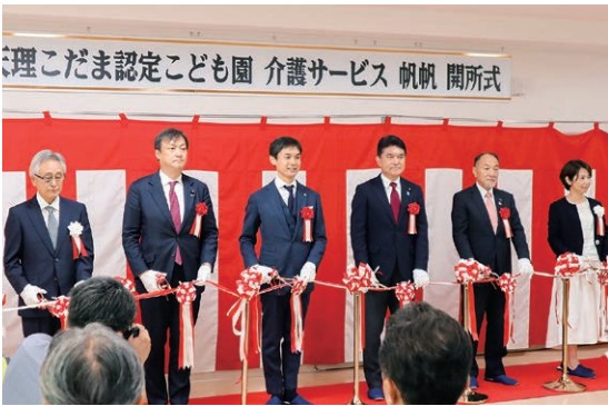
令和5年6月 介護サービス帆帆 天理こだま認定こども園 開所式にて