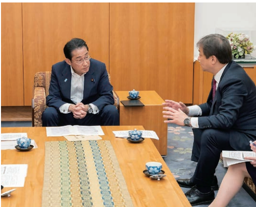
令和5年6月 自由民主党外交部会長として岸田総理に申し入れ