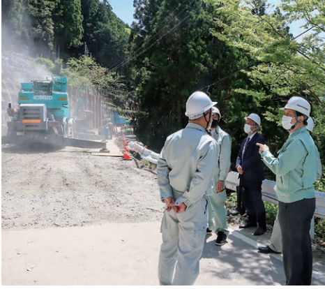
令和5年4月 国道168号線長殿地区崩壊現場にて