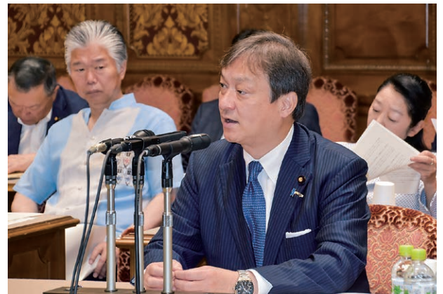
令和5年6月 財政金融委員会・外交防衛委員会連合審査会にて質問