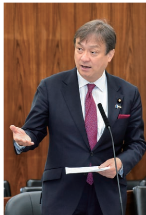
令和5年5月 参議院外交防衛委員会にて 質問