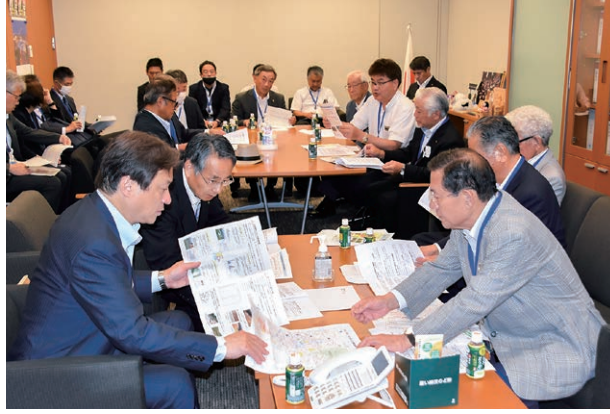
令和5年7月 奈良県土地改良事業団体連合会より政策提案