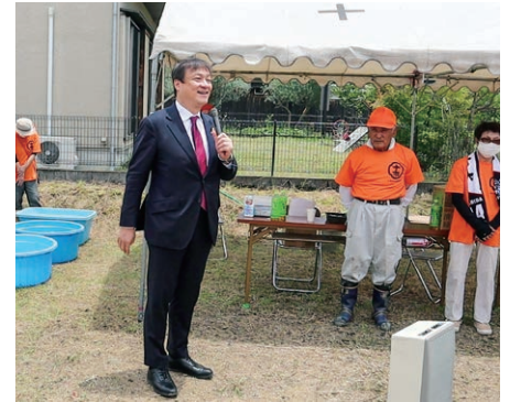
令和5年6月 橿原市十市町田植え祭にて