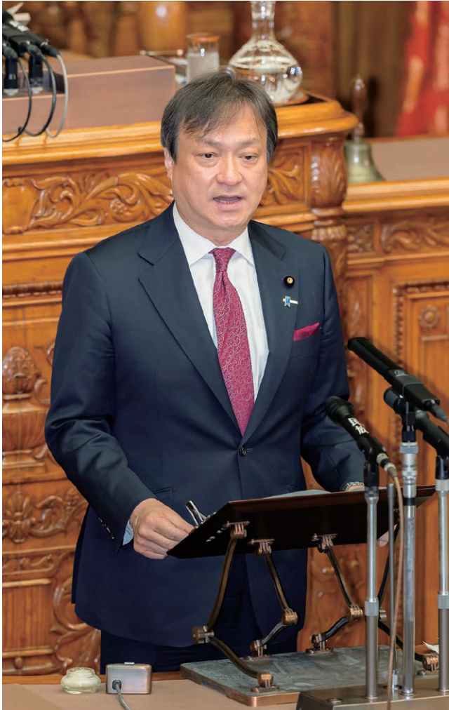
令和5年4月参議院本会議にて、防衛三文書について質問