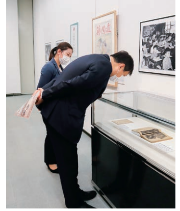
令和5年6月 日本遺族会昭和館巡回特別企画展にて