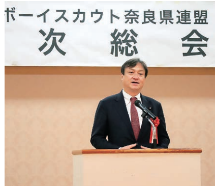
令和5年5月 日本ボーイスカウト奈良県連盟年次総会 にて