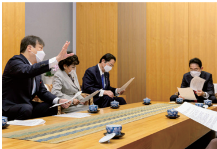
令和4年12月自民党外交部会長として総理に申入れ