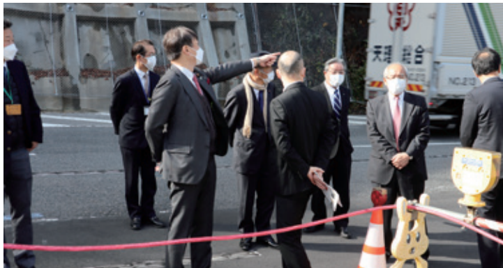
令和4年12月 国道169号三村管内道路視察