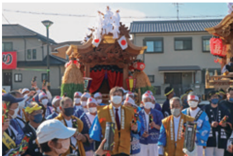
令和4年11月 橿原市 今井の地車、十市の地車だんじり曳行体験