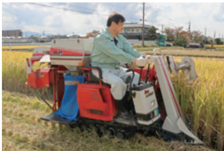
令和4年10月 天理市内において稲の刈取作業体験