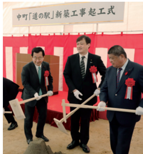
令和4年11月 奈良市 中町「道の駅」新築工事起工式