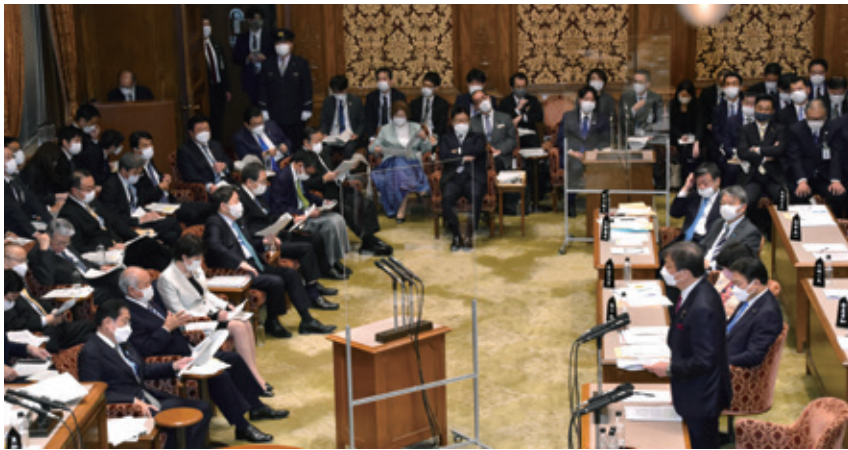
令和4年11月 参議院予算委員会にて